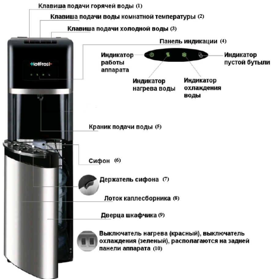
Рисунок 1. Схема аппарата 35AEN

Данный аппарат предназначен для нагрева и охлаждения питьевой бутилированной воды, расфасованной в поликарбонатные бутылки объемом 10-19 литров.