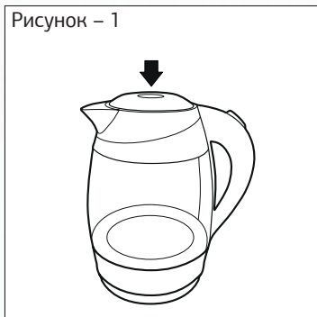
Рисунок – 1