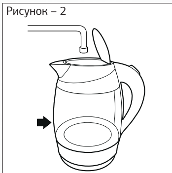
Рисунок – 2

— Наполните чайник холодной водой, следите за метками.