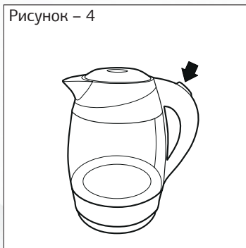
Рисунок – 4

— Включите чайник, нажав кнопку (переведя выключатель в положение 1).