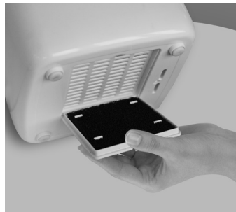
Рис. 9 Фильтр очистки воздуха Pre-filter

Воздух может содержать в себе различные примеси, которые могут при дыхании попадать в дыхательные пути человека или оседать в приборах. Фильтр очищает воздух от крупных фрагментов пыли, шерсти и защищает внутреннюю часть прибора и комплектующие от пыли и прочих примесей.