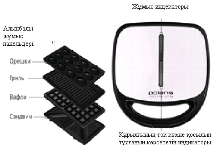
1-суретте берілген құрылғының сипаттамасы