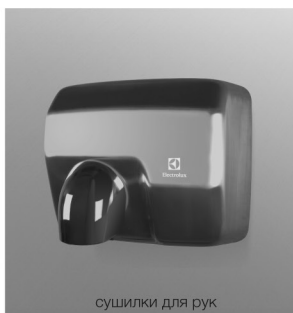
сушилки для рук