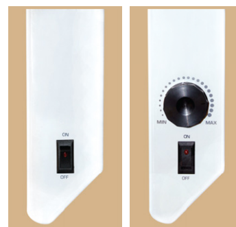
Панель управления на модели 0,5 кВт